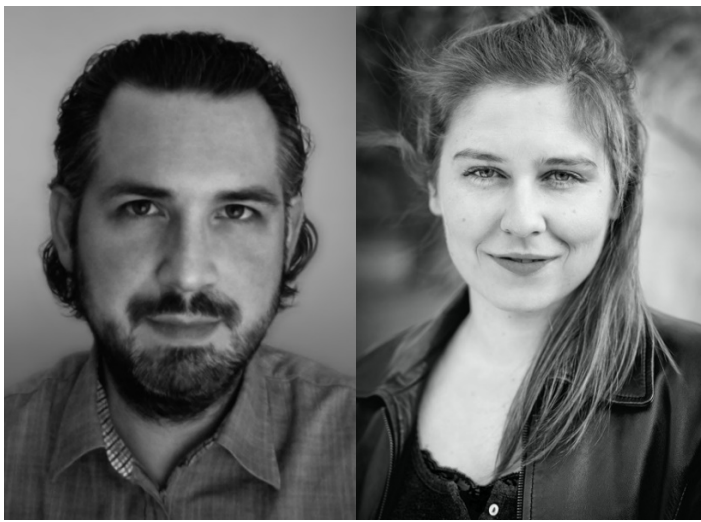
Copyright: Matthias. A. K. Zimmermann Copyright: Borkh Photography

Matthias Alexander Kristian Zimmermann , 1981 in Basel geboren, ist Schriftsteller, Maler und Medienkünstler. Der im Kanton Aargau aufgewachsene Schweizer studierte musikalische Komposition, Kunst & Vermittlung, Game Design, Art Education und Pädagogik. Mit seinen Bildern – der Künstler spricht von „Modellwelten“ – reflektiert und erforscht er die Kunst-, Design- und Mediengeschichte und ist in den Sammlungen diverser Museen vertreten. Sein Werk wird im Kunst- und Sachbuch „Digitale Moderne. Die Modellwelten von Matthias Zimmermann“ (Hirmer Verlag) besprochen. Sein Roman „Kryonium. Die Experimente der Erinnerung“ erschien im Kulturverlag Kadmos. https://www.matthias-zimmermann.ch