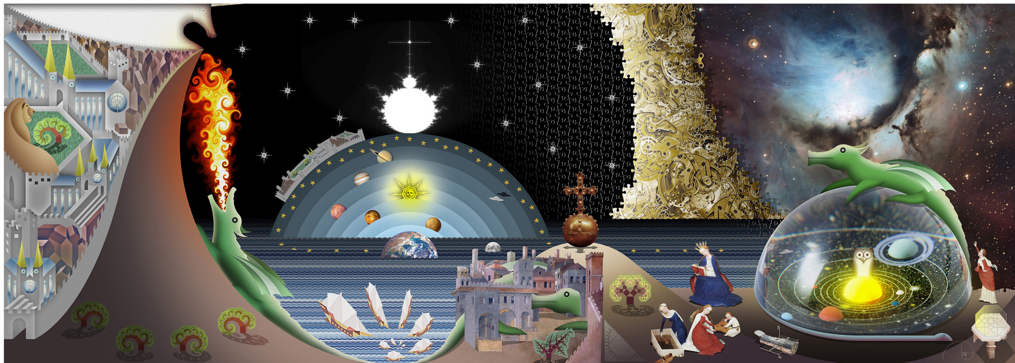
Die Welt in Kryonium erinnert an die Digitalkompositionen des Autors, beispielsweise «Die Weltbilder des mechanischen Flächenlands».